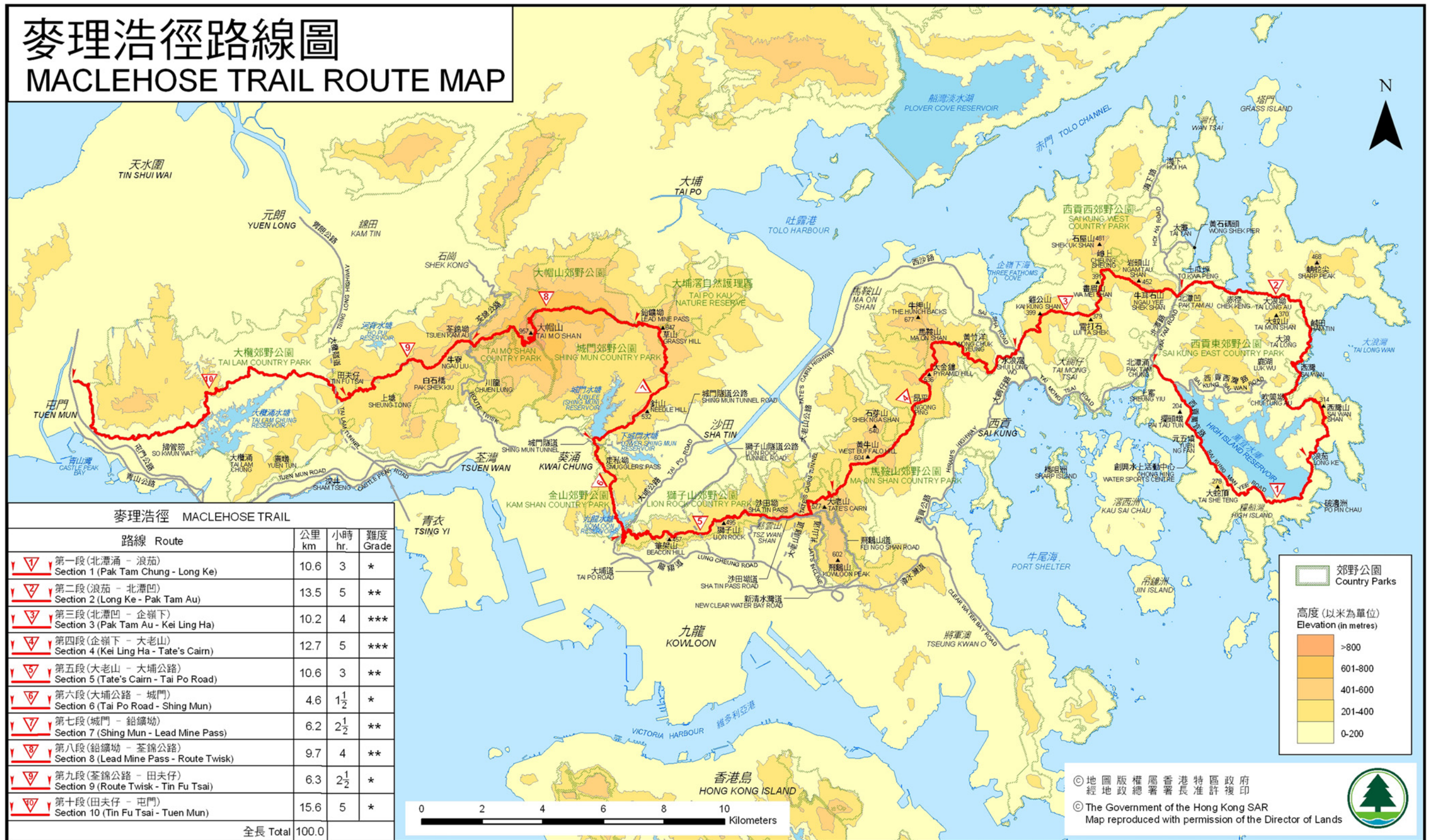
麥理浩徑 MACLEHOSE TRAIL